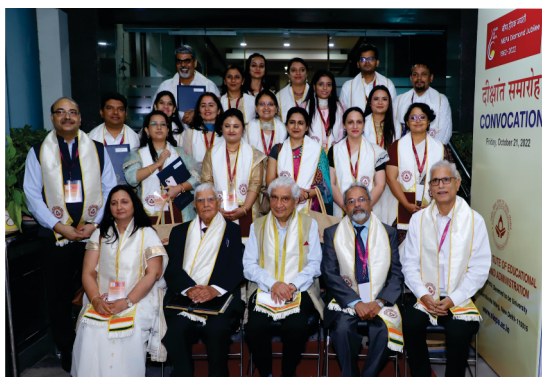
दीक्षांत समारोह 21 अक्टूबर, 2022

पीएचडी कार्यक्रम के लिए पंजीकृत अध्येताओं को किसी अनुमोदित विषय पर कार्य करना होगा और आवंटित शोध-निर्देशक के अधीन अपना शोधकार्य प्रस्तुत करना होगा। विश्वविद्यालय अनुदान आयोग के दिशा-निर्देश के अनुसार प्रत्येक अध्येता को डॉक्टरल सलाहकार समिति (डीएसी)