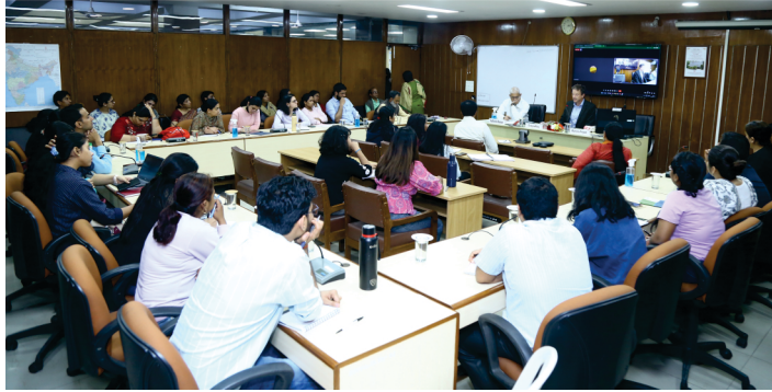
नीपा शोधार्थियों के साथ पारस्परिक विचार-विमर्श

इस कार्यक्रम का उद्देश्य विविध पृष्ठभूमि के अध्येताओं की शोध क्षमता का निर्माण करना तथा शैक्षिक नीति, योजना, प्रशासन और वित्त से संबंधित क्षेत्रों में ज्ञान और कौशल का आधार प्रदान करना है। पीएचडी कार्यक्रमों के अन्तर्गत पूर्ण किए गए शोधपरक अध्ययनों से यह आशा की जाती है कि इनसे नीति निर्माण, सुधारात्मक कार्यक्रमों तथा अन्य क्षमता निर्माण जैसे क्रियाकलापों के कार्यान्वयन के अलावा ज्ञान के आधार को समृद्ध करने में योगदान होगा। विद्यालय और/अथवा उच्चतर शिक्षा के समेकित मुख्य शोध क्षेत्र निम्नवत हैं: